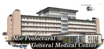
Mie Prefectural General Medical Center