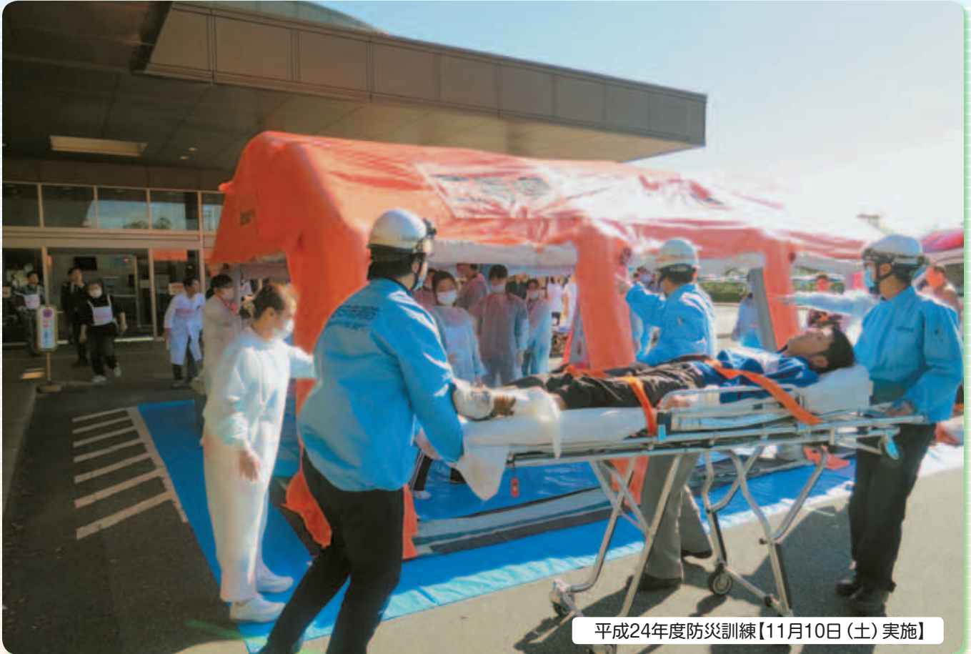
平成24年度防災訓練【11月10日(土)実施】